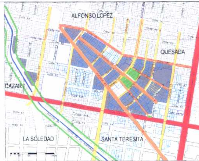
Inmuebles de Interés Cultural - MORFOLOGÍA EN PLANTA