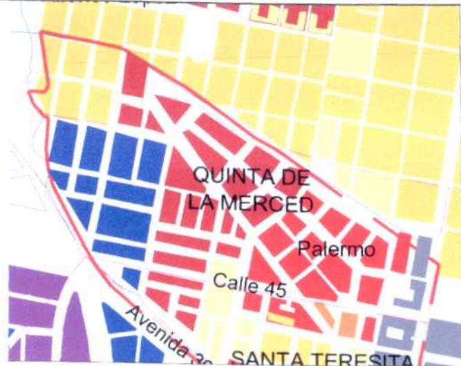
CRECIMIENTO HISTÓRICO - CRONOLOGÍA